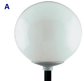
BASE: Aluminio inyectado